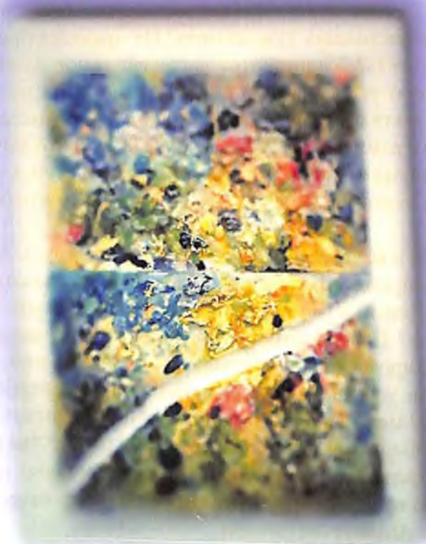
Правый и левый берег