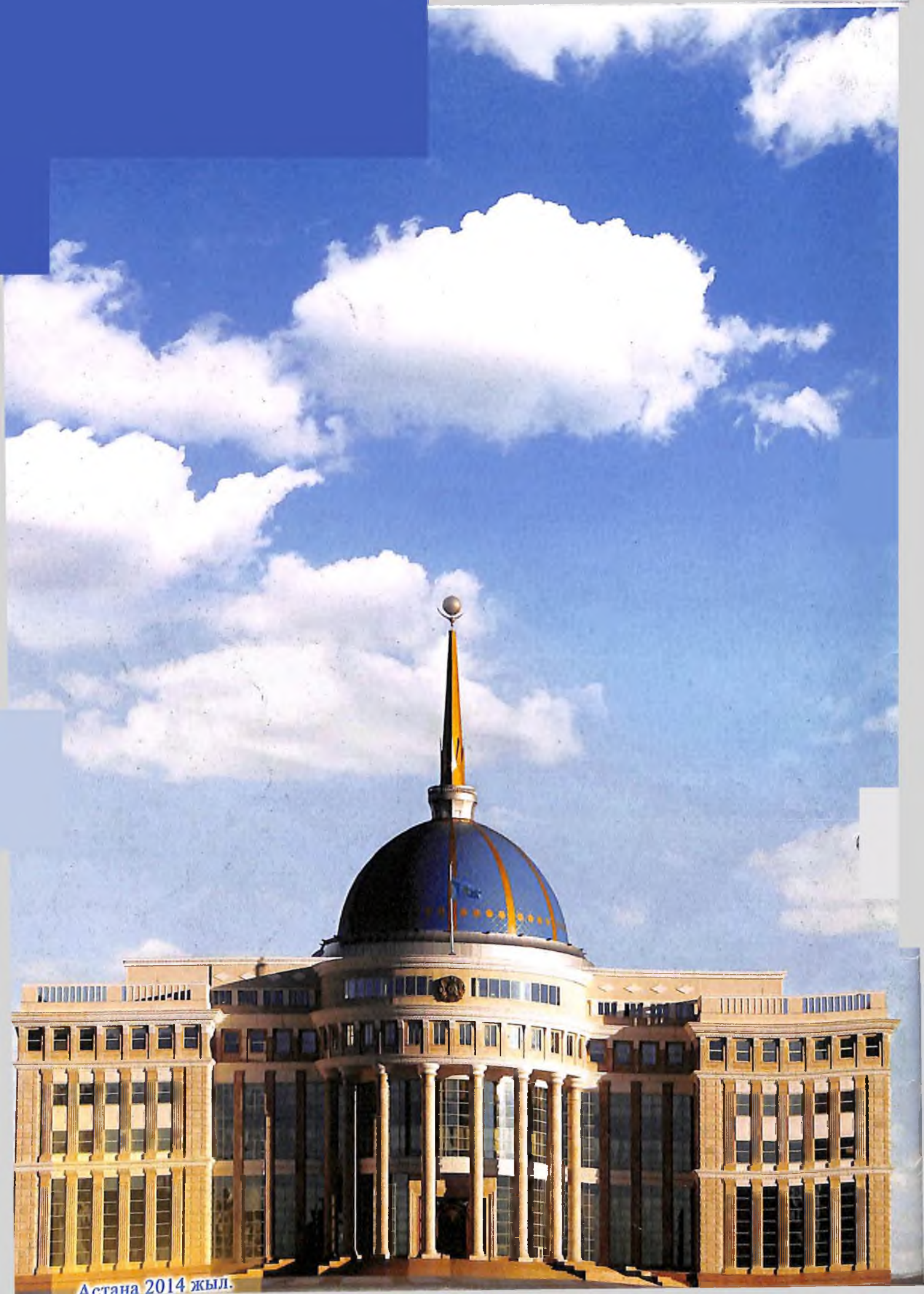
Астана 2014 жыл.