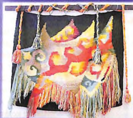
Ою – өрнек композициясы