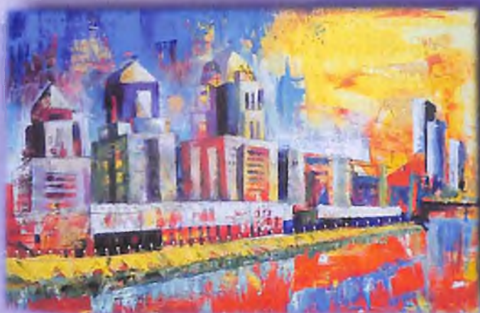
Город со светодиютому