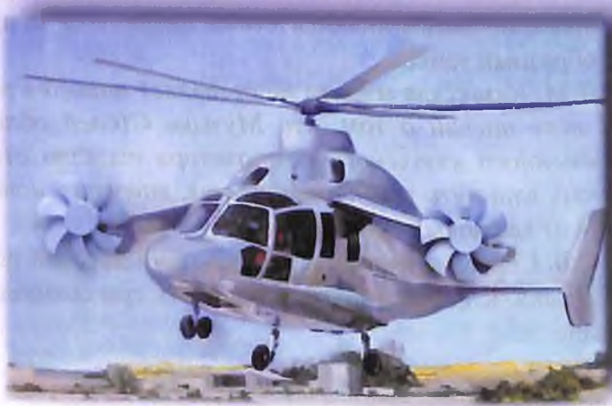
Вертолет с Ветерком